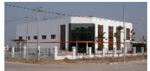
gerade fertiggestellt – die neue Produktionsstätte in Kunshan bei Shanghai just completed... the new production plant in Kunshan near Shanghai